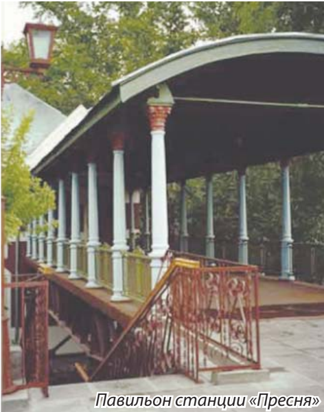
Павильон станции «Пресня»

С 1 июля 1908г. Московская Окружная железная дорога перешла со всеми ее соединительными ветвями в ведение Управления Николаевской железной дороги. Был издан «Приказ по Николаевской железной дороге (С-Петербург, июля 16 дня 1908г. № 174.) Об открытии движения по Московской Окружной железной дороге», в котором говорилось следующее: «В 12 часов ночи, с 19 на 20-ое сего июля на Московской Окружной дороге, как по кольцу, так и по соединительным ее ветвям, открывается движение пассажирских и товарных поездов, согласно летнему расписанию, утвержденному с 20 июля по 15 октября сего года..».