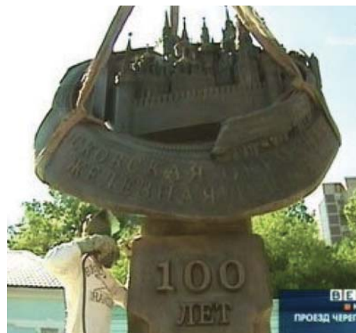
Памятная стела в честь 100-летия открытия движения по Малому кольцу МЖД

Все эти вопросы требовали решения, поэтому 1 октября 2007г. Правительством Москвы и ОАО «РЖД» было подписано соглашение, предусматривающее совместную реализацию в 2007–2009гг. проекта реконструкции первоочередного