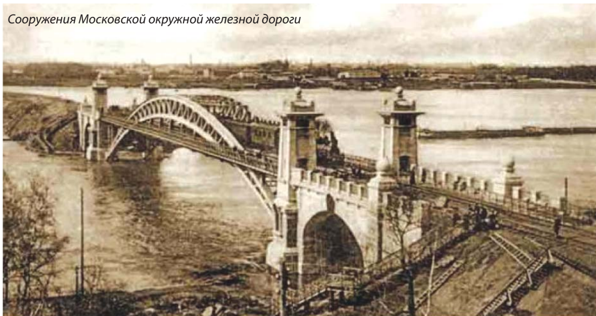
Сооружения Московской окружной железной дороги

К лету 1908г. по кольцу в сутки ходило две пары товарно-пассажирских поездов; таким образом, персонал дороги приобретал практический навык организации движения.