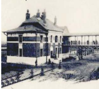
Пассажирское здание на ст. Пресня

Официально строительство Окружной дороги началось 3 августа 1903г. На ее сооружении работало около 1300 чело-